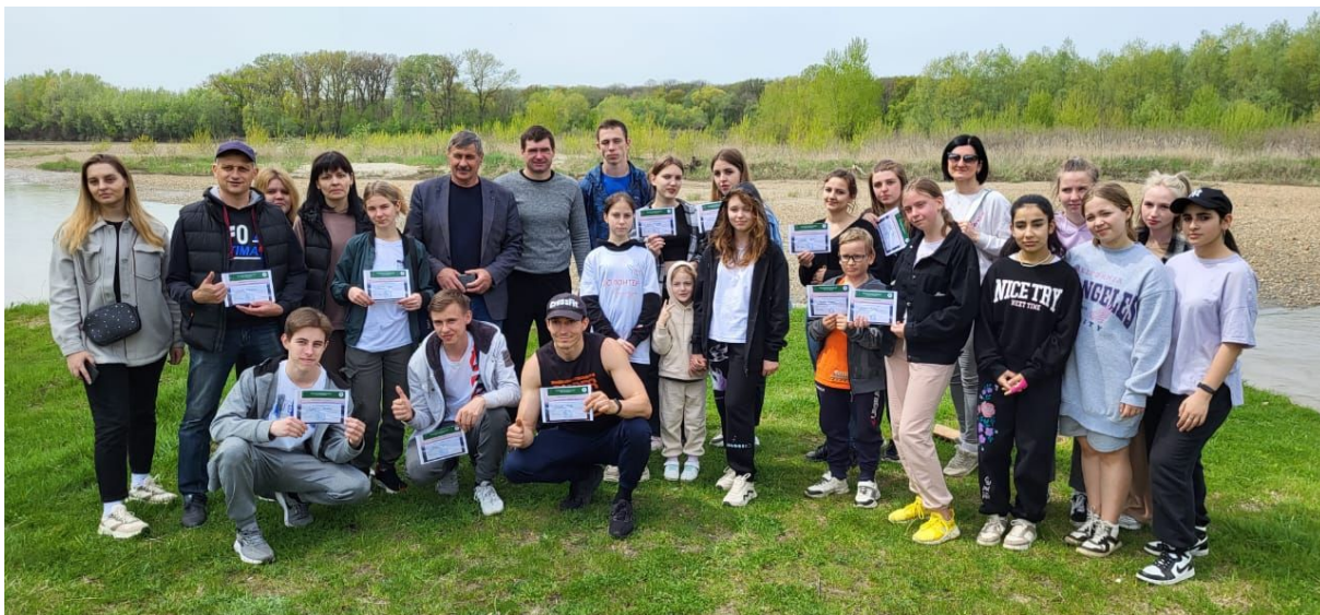
Рис. 10. Эко-плоггинг «Зеленая миля». Участники эко-плоггинга, общее фото

Акция подошла к концу. И мы думаем, это был именно наглядный урок и для участников, и для местных жителей, как не надо относиться к природе, ведь она тоже может ответить нам за все это: цунами, тайфуны и ураганные ветры все чаще приходят на нашу планету.