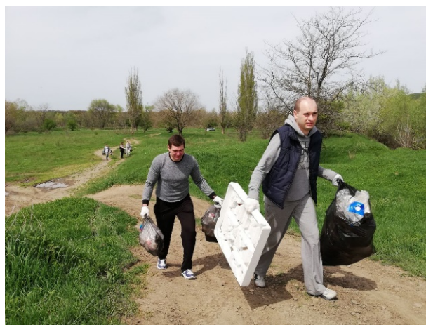
Рис. 7. Эко-плоггинг «Зеленая миля». Начальник отдела культуры администрации муниципального образования г. Армавира – один из участников эко-плоггинга