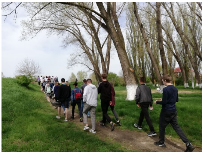
Рис. 4. Эко-плоггинг «Зеленая миля». Старт экологической пробежки

добилась их дополнительная поставка. Всего было собрано более 1,5 т мусора, который был транспортирован на мусороперерабатывающий завод.