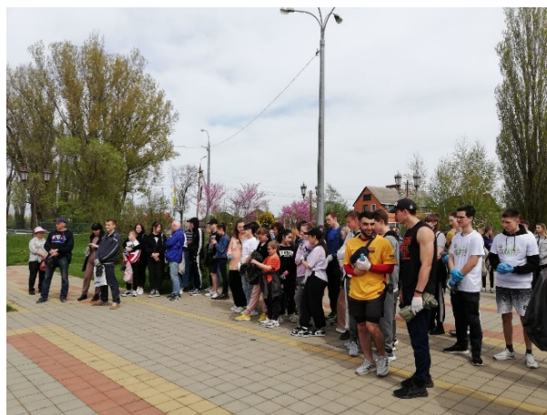
Рис. 2. Эко-плоггинг «Зеленая миля». Сбор участников в «Сквере Влюбленных»