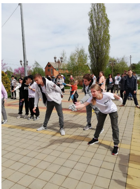
Рис. 3. Эко-плоггинг «Зеленая миля». Разминка с фитнес-тренером перед забегом

И вот дан старт. Большая группа двинулась вдоль правого берега реки до подножия Стрижибиной горы, на которой располагается х. Фортштадт. Маршрут включал в себя и спуски в овраги, и бег по пересеченной местности. Кто-то бежал, кто-то шел размеренным шагом, но у всех была одна цель – очистить места «дикого отдыха» от пластика и полиэтилена, которые наносят природе наибольший вред. По мере прохождения маршрута мешки увеличивались в размере и даже пона-