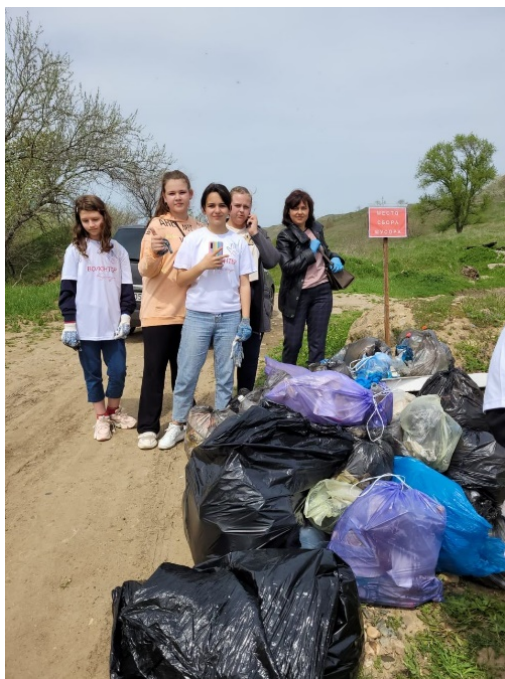
Рис. 8. Эко-плоггинг «Зеленая миля». Место сбора мусора