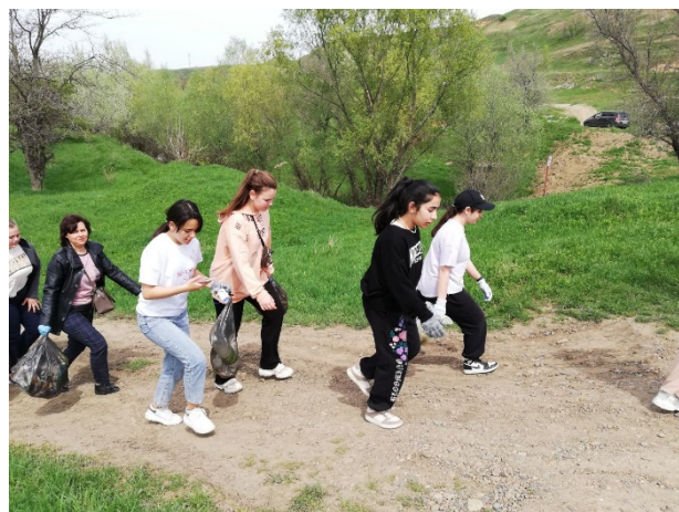
Рис. 6. Эко-плоггинг «Зеленая миля». Участники эко-плоггинга на маршруте – читатели библиотеки, волонтеры, старшее поколение